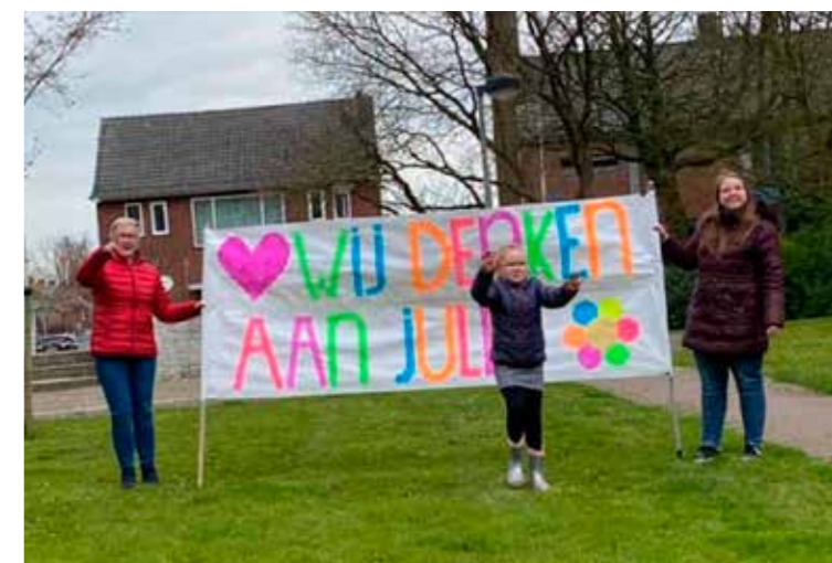
Krijttekeningen en spandoeken om medewerkers een hart onder de riem te steken...