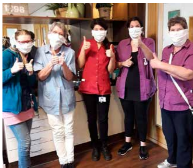
Een 95-jarige cliënt in Sliedrecht naaide zelf mondkapjes voor het thuiszorgteam!

Vanaf het begin van de crisis heeft vooral de wijkverpleging veel met besmettingen onder de cliënten (en medewerkers) te maken. Zij zijn, zeker in die gevallen van besmetting bij een cliënt, vaak de enigen die nog lijfelijk 'over de vloer' komen. Dagelijks hebben zij te maken met mensen die vereenzamen en voor wie zij nog het enige persoonlijke contact vormen.