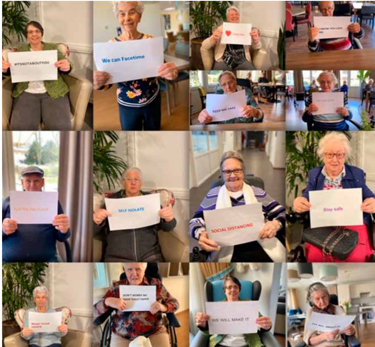
De bewoners van afdeling Baanhoek in verpleeghuis Overslydrecht deelden een boodschap.