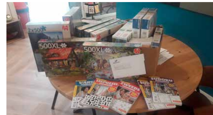
BMN De Klerk en Novafront uit Hardinxveld-Giessendam spraken hun waardering uit voor de zorg en schonken onze ouderen in zorgcentrum Pedaja een mooi puzzelpakket, met legpuzzels en puzzelboekjes.