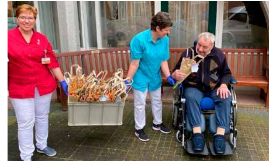
Er werden dozen en kratten vol bossen tulpen bezorgd voor de bewoners en zorgverleners van De Waard, namens heel Alblasserdam.