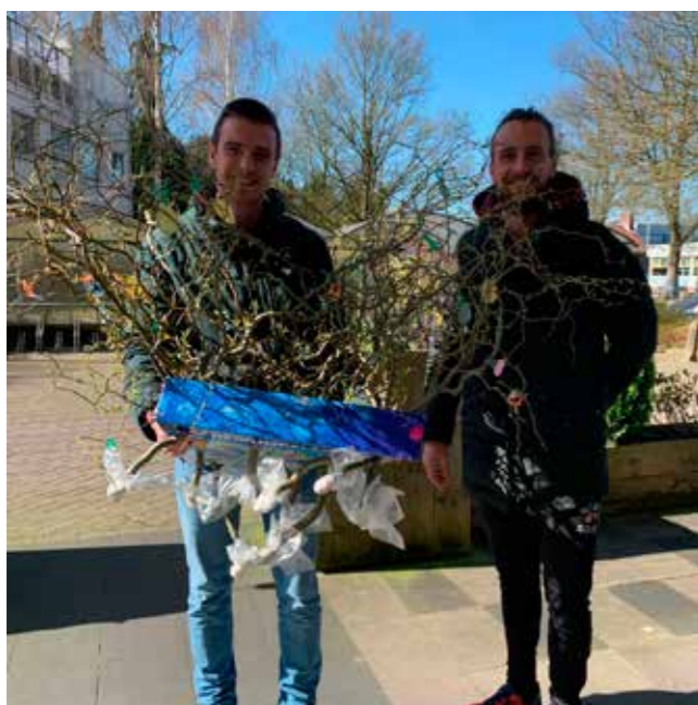
Paastakken van de Stichting Open Jeugd Sliedrecht voor verpleeghuis Overslydrecht.