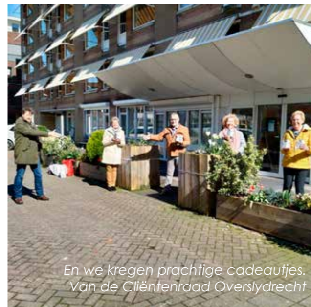
En we kregen prachtige cadeautjes. Van de Cliëntenraad Overslydrecht